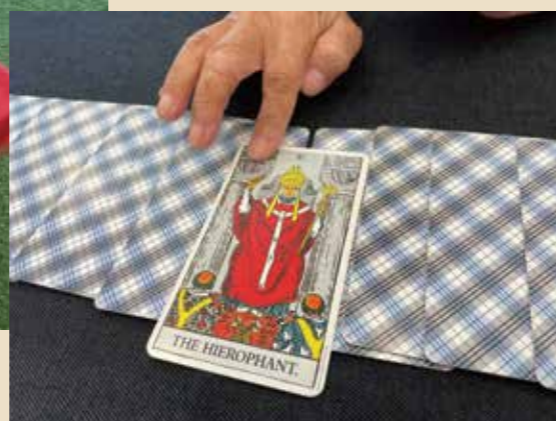
このカードにはどんな意味があるのかな…？

—渡辺さんは今年6月からみなまきTRYSTANDで「花と鳥」という屋号でタロットカード占いをされていますね。タロットカード占いは以前からされていたのですか？