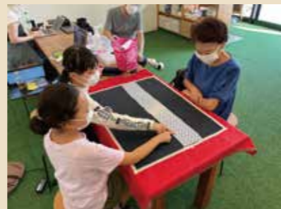
このカードがいい！！