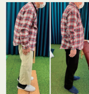
モデルさん 83歳 2年経過

その不調、実は骨の歪みから きているかも。生活習慣を見直し、 一緒に健康を目指しましょう。